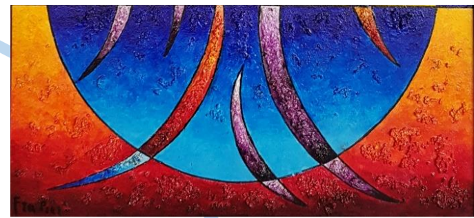
Opere di fra Pier dell'Abbazia di Piona (Lc)

I cambiamenti fanno parte della nostra vita.